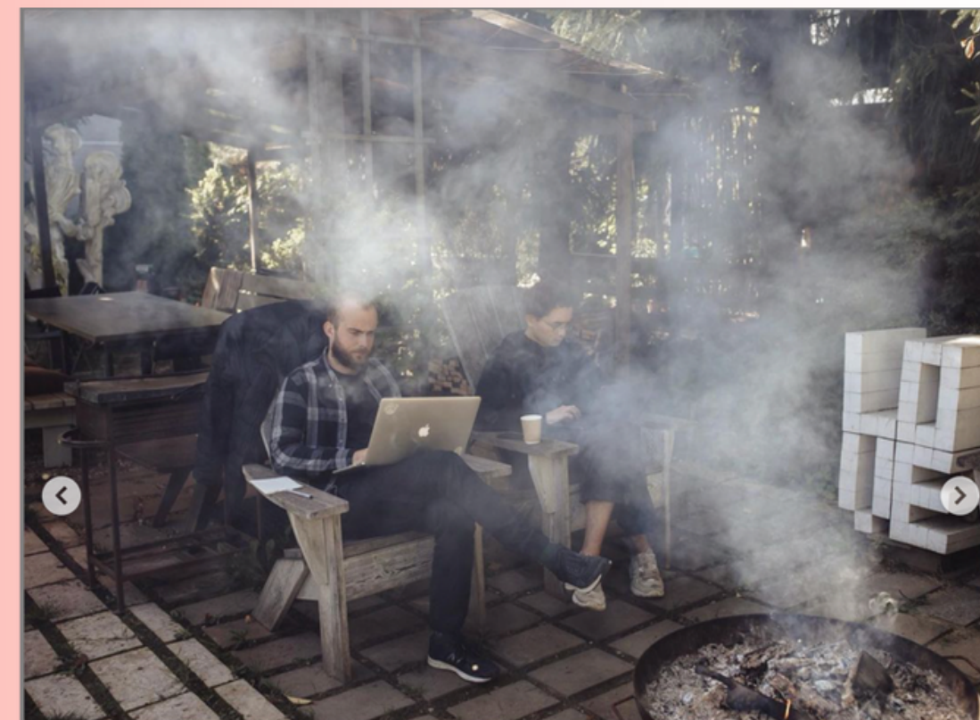
Компания «ЦЕНЦИПЕР» проект «Рабочая среда»